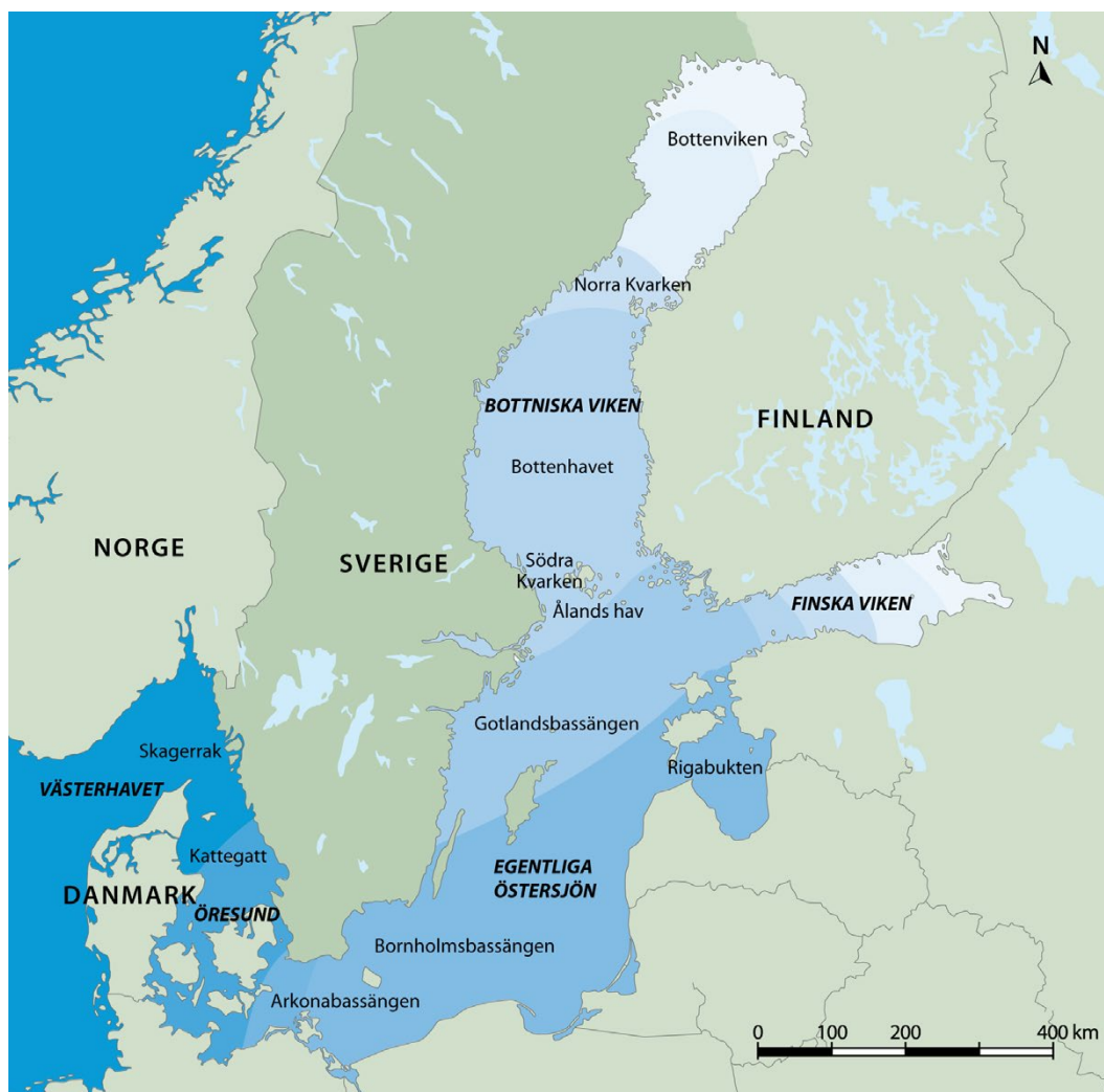
Figur 1. Sveriges havsområden. Sverige har, jämfört med andra länder i EU, en mycket lång kuststräcka. Vattenmiljön skiljer sig åt bland annat på grund av salthaltgradient från norr till söder, med 2–3 promille i Bottenviken, ca 5 promille i Bottenhavet, runt 10 promille i Öresund och uppåt 30 promille i Skagerrak.

Rapporten baserar sig på vetenskapliga artiklar och rapporter som berör hur fisk påverkas av havsbaserad vindkraft, samt även andra publikationer om fiskars biologi och ekologi och hur fisk reagerar på annan typ av mänsklig aktivitet. För att få en heltäckande bild om kunskapsläget kring hur vindkraft påverkar fisk har sökningar på relevant referensmaterial utförts utifrån olika databaser (ISI Web of Science, Google scholar, ResearchGate m.fl.) där studier utförda under senare tid har varit av särskilt intresse.