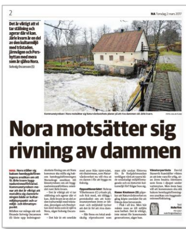
Nerikes Allehanda, 2017-03-02.