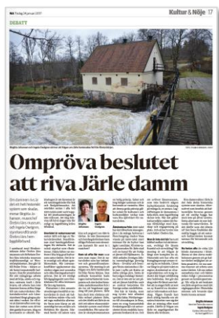
Nerikes Allehanda, 2017-01-24.

Nerikes Allehanda återger i mars 2017 att kommunstyrelsen i Nora motsätter sig en rivning av dammen.