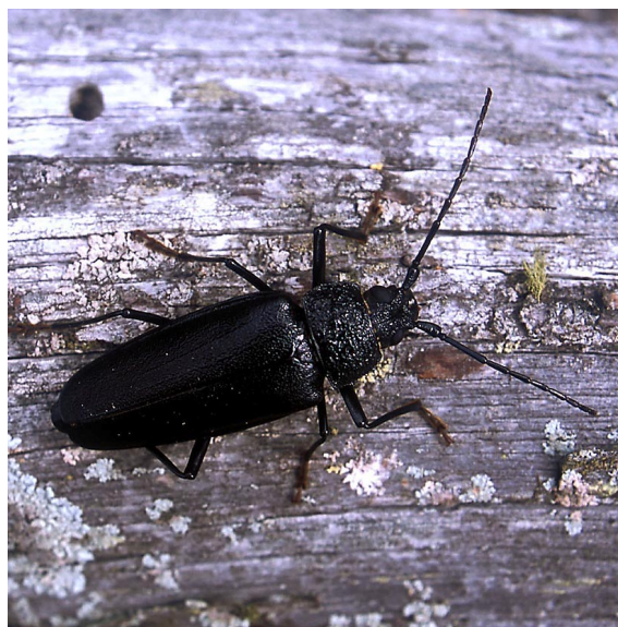
Jättevedbocken, Ergates faber , en av Sveriges största skalbaggar, förekommer på Ryssnäs.

Ryssnäs utgör den allra sydligaste delen av Fårö. Den norra delen av området är bevuxen med gles och betespräglad tallskog, där många av tallarna har en betydande ålder. I de ge gamla solexponerade tallarna lever larver av flera arter vedlevande insekter, och bl.a. förekommer här jättevedbock. Här finns också två mindre våtmarker, Hyluvät och Graunkullamy, som i Länsstyrelsens våtmarksinventering bedömts ha högt (klass 2) respektive särskilt högt värde (klass 1) från naturvårdssynpunkt. Den södra delen av området upptas av öppna fårbetesmarker med vackra, välutbildade klapperstensvallar. På den södra delen av udden häckar fåglar som fiskmåsar (ca 50 par), silvertärnor (ca 25 par) och småtärnor (15-20 par). På den östra delen av Ryssnäs ligger den s.k. Engelska kyrkogården, och hela området är sommartid ett välbesökt utflyktsmål.