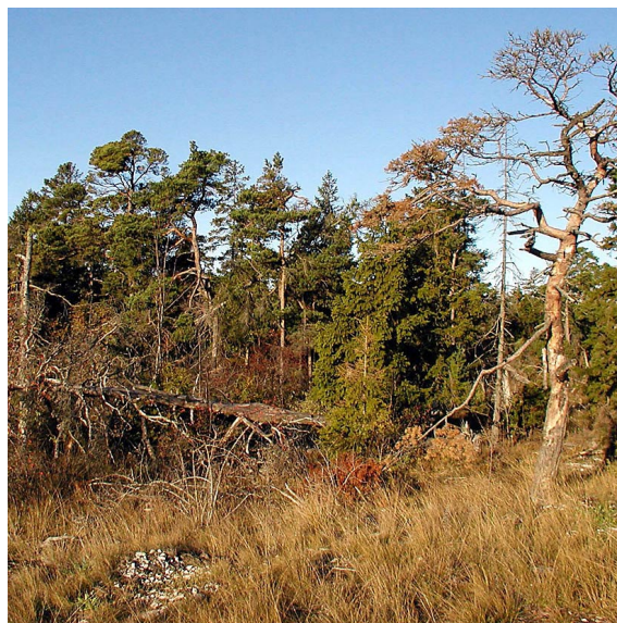
I Burggatskog på Tofta skjutfält finns stora mängder död ved.

Barrskogsområde som delvis ligger ovanför, delvis nedanför den bergsbrant som sträcker sig från Stavsklint ned mot Marsängen på Tofta skjutfält. Trädslagssammansättningen i området är mycket varierande: inom vissa delar dominerar tall, inom andra gran. Många av tallarna är gamla och spärrgreninga, medan granarna överlag är senvuxna. Inom området förekommer rikligt med död ved i form av stående döda träd, högstubbar, lågor m.m; den stora mängden död ved är i stor utsträckning ett resultat av den militära övningsverksamheten. Något skogsbruk har inte förekommit i området sedan början av 1900-talet. Området är rikt på lavar (bl.a. kattfotslav) och mossor (bl.a. blåmossa, platt fjädermossa och västlig hakmossa). I den mellersta delen av området finns en rik förekomst av röd skoglilja. I den nedre delen av området, söder om Blåhäll, finns en del mindre våtmarker av källmyrskaraktär. Här finns också en lokal för den mycket sällsynta dolkstekeln Scolia hirta .