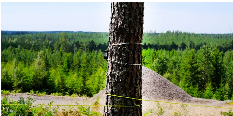
Ljudbox för att registrera tiggande kungsörnsungar i Kronobergs län.

Terrängen avgör var man lämpligast placerar en ljudbox. En grundregel är att avståndet till den förmodade eller kända boplatsen bör vara mindre än 1,5 km. Ljudboxen bör helst placeras på en trädstam i gles skog utan berg, andra terrängformationer eller tät ljuddämpande skog mellan boxen och den förmodade eller kända boplatsen. Om boet är placerat på ett berg, bör man rikta