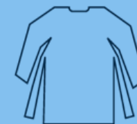
TrioSafe LS (Long Sleeve Gown)