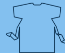
TrioSafe SS (Short Sleeve Gown)