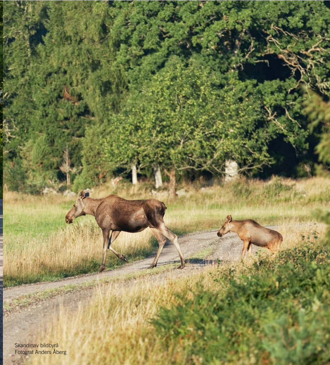
Skandinav bildbyrå Fotograf Anders Åberg